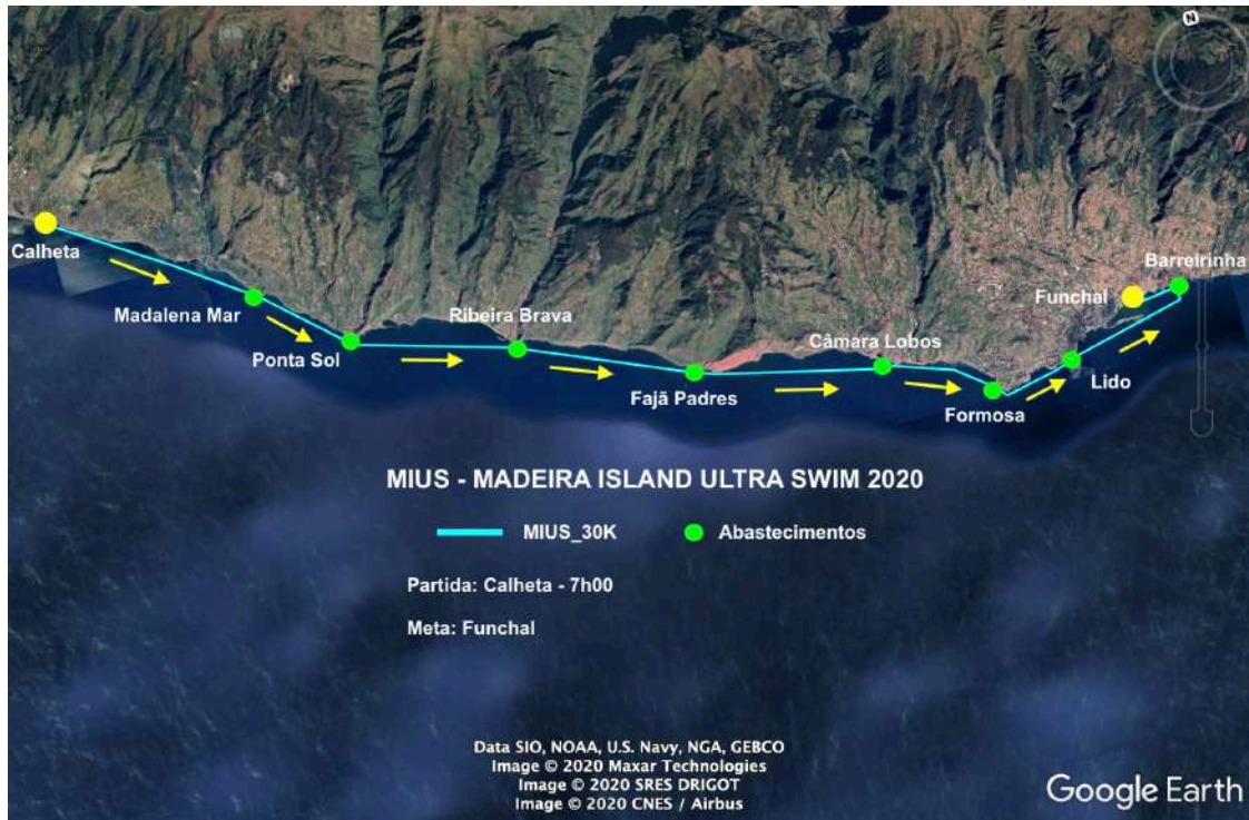
Figura 2: MIUS®_30K_Calheta/Funchal