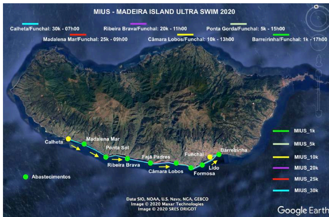
Figura 1: MIUS® - Madeira Island Ultra-Swim®