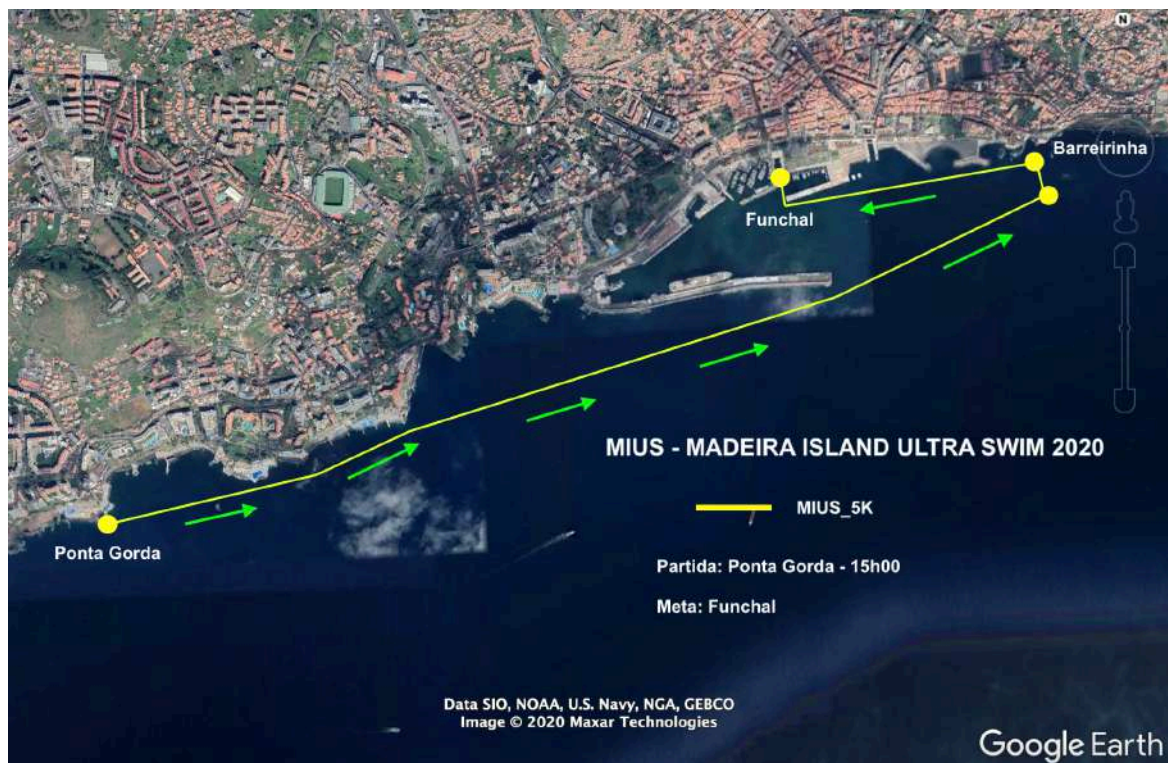
Figura 5: MIUS®_5K_Ponta Gorda/Funchal