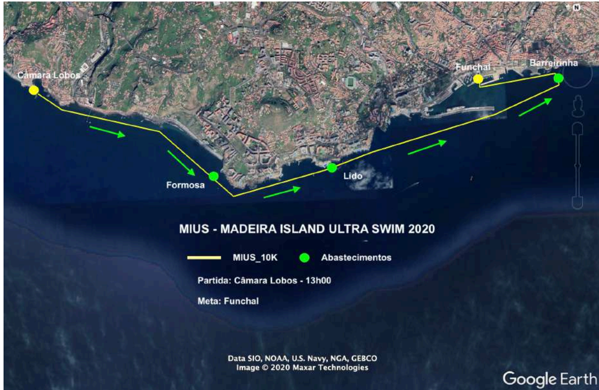
Figura 4: MIUS®_10K_Câmara Lobos/Funchal