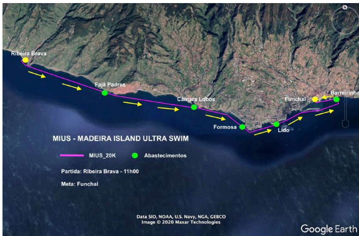
Figura 3: MIUS®_20K_Ribeira Brava/Funchal